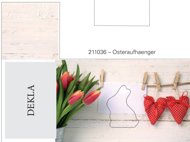
211036 – Osteraufhaenger