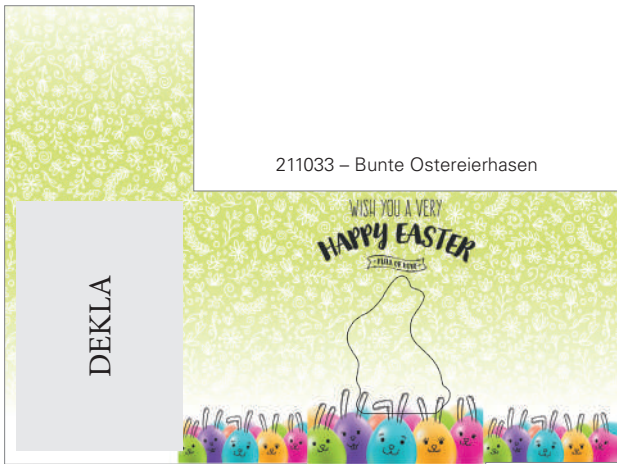
211033 – Bunte Ostereierhasen