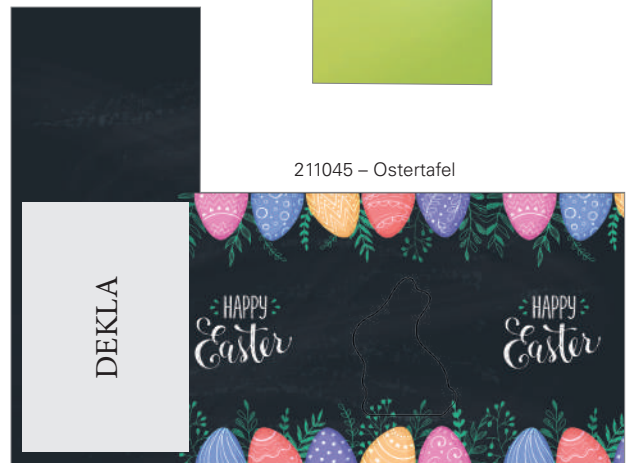
211045 – Ostertafel