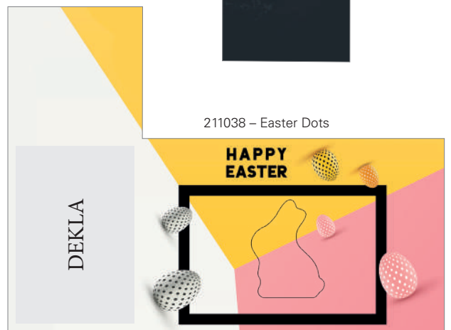
211038 – Easter Dots