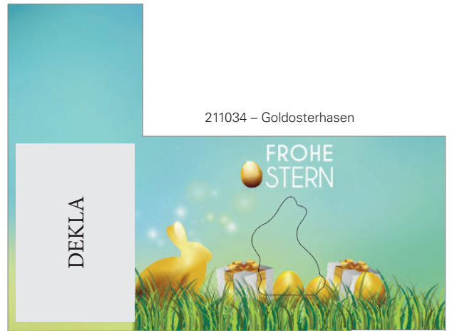
211034 – Goldosterhasen